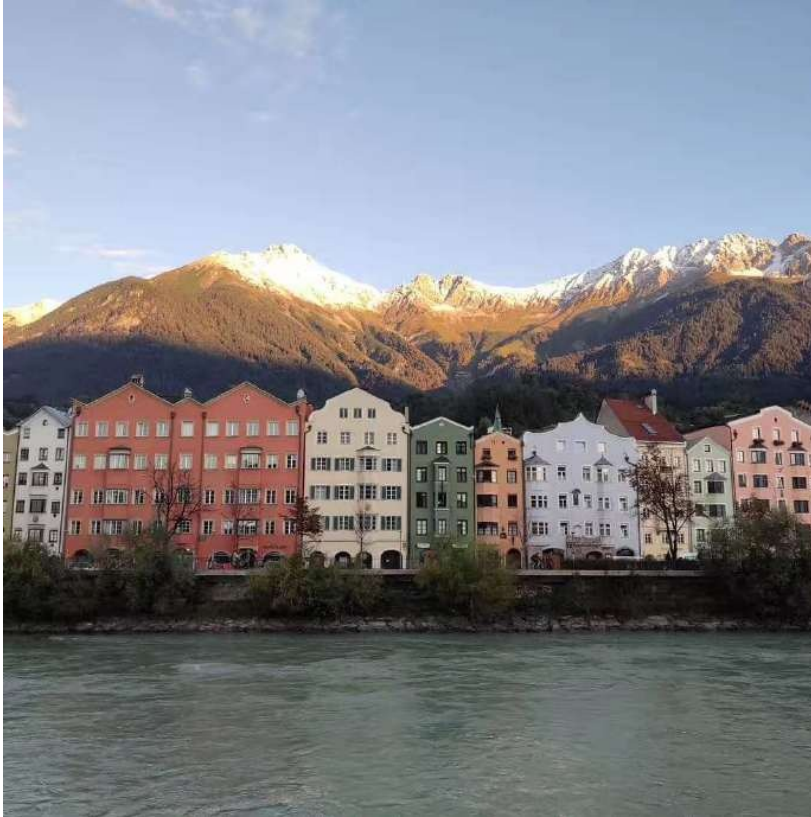
图 茵河畔 一、优良的学习环境

离开“茵村”回到国内已有半年光阴，感慨时光不经意溜走了，生活中的一些场景常让我回想起在奥地利因斯布鲁克交换生活，脑海里对这段生活的印象还十分清晰。我很喜欢这段短暂的阿尔卑斯山小城之行，当初选择交换项目时，因斯布鲁克大学是我一眼中意的选择，几经周折最终有幸与它相遇。与上海的现代都市生活不同，奥地利第五大城市——因斯布鲁克的生活是宁静缓慢的，那里有静静流淌的茵河、积雪的阿尔卑斯山和热心友好的人们，在学习和游历欧洲之际，我还会在房间里思考自己“向往的生活”，此外，这几个月的独立生活大大锻炼了个人生活能力，我的因斯布鲁克之行收获颇丰。