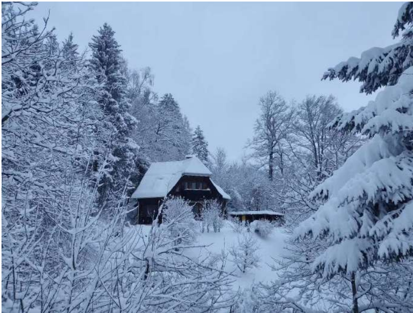
图 从半山腰俯瞰因斯布鲁克 如果你以后也想来到因斯布鲁克交换，这会是个不错的选择，至少我在德国汉堡和法国巴黎交换的同学们都很喜欢这个小城市，而且这里位于奥地利、德国、意大利、瑞士交界处~如果需要一些行李建议，我想说，带点中国调料轻装上阵就足够！