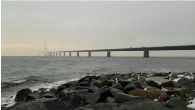
图二：丹麦日常天气 阴天

来之前一个丹麦的朋友告诉我，十月份就像中国的冬天一样，之后的十一月十二月就更难以想象了，但我很有幸地度过了哥本哈根史上最暖和的十一月和史上最暖和的十二月。有