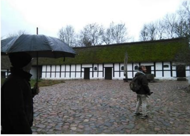
图一：丹麦日常天气阴天下雨，图为我和两位 mentor 去逛菲英村展

很难想象在这个世界上最幸福的国家，我经历的日子里大部分时间都是阴天下雨的，时常伴有大风。已经数不清被雨淋过多少次了，来的第三天就被大雨淋得淋漓尽致。经常的状况是早晨八点骑车出发，才发现外面下着小雨，但为了八点半开始的课不迟到，努力地顶风冒雨骑行，雨越来越大，一边自言自语地抱怨一边气喘吁吁地踩着脚踏板，终于停好车冲进教学楼，衣服湿得都可以拧出水，顶着被雨打湿的一缕一缕的头发上完课，发现外面天气放晴了。除了哥本哈根爱下雨这个原因之外，也许因为我没有出门带伞的习惯，开始的时候发现哥本哈根人骑车时从来不打伞，后来才知道他们是穿雨衣的。