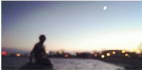
图八：小美人鱼铜像

五个月的时间不长也不短，走的时候很舍不得这里的一切，但爱丽丝从兔子洞里出来还是要回到她本来的世界。特别喜欢安徒生博物馆中文版小册子上的一句话，是安徒生写在《全家人讲的话》里的，就用来结尾吧——活着本身就是一个精彩的童话：)