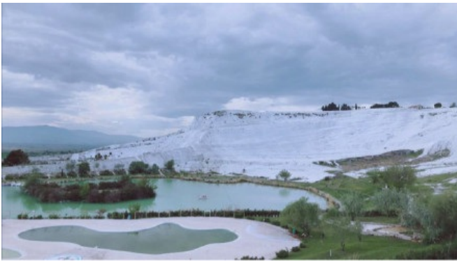
（“上帝打翻的牛奶瓶”——土耳其棉花堡）

最简单的，大家都能想到的社交活动就是参加各种社团啦！我在这里抱歉没法给大家提这方面的建议，因为我个人不是特别热衷于社团活动。 Exeter 的学校主楼 hall 里会时不时有各个社团的展演，过年的时候舞龙社还在学校 studio 举行了表演，同时还有烘焙社，手工社等等，一般大学有的社团组织， Exeter 都会有，不过是个人的选择，你可以仅仅吃瓜，也可以积极参与，每个人消遣方式不同，生活感触不同，自己过得舒服就好，毕竟日子是自己的，没有定式~