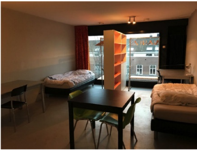
图 1 我和C同学住的宿舍