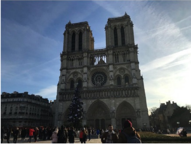
图 6 游历巴黎圣母院（如今已被烧毁）