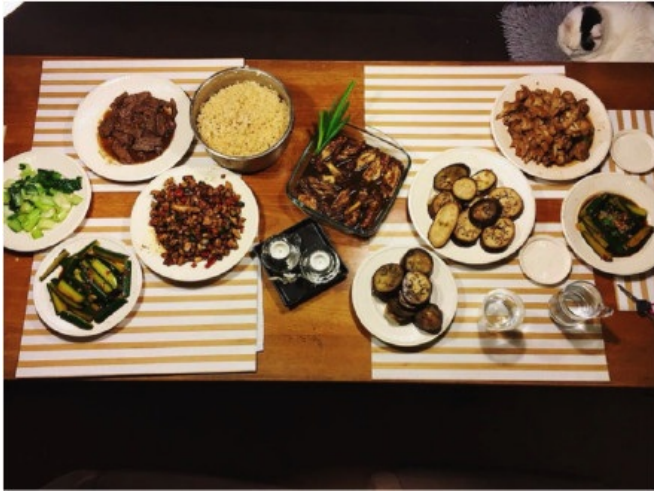
图 2 在Daniël家做的晚餐