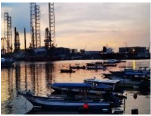
无滤镜的最美日落

无滤镜的最美日落 我真真切切的在这四个月的时间里感受到了成长。是年龄上的，我在这里过了春节，也过了我的二十岁生日；是身体上的，我在这里健康饮食与锻炼，强健了我的体魄；更是心灵上的，我经历了一开始身处异国他乡的文化冲击，经历了担心没书读的焦虑，经历了广投简历而毫无回音的自我怀疑，经历了一系列陌生到我以为我一定做不成但最终成功的事。而因此，我为自己骄傲。