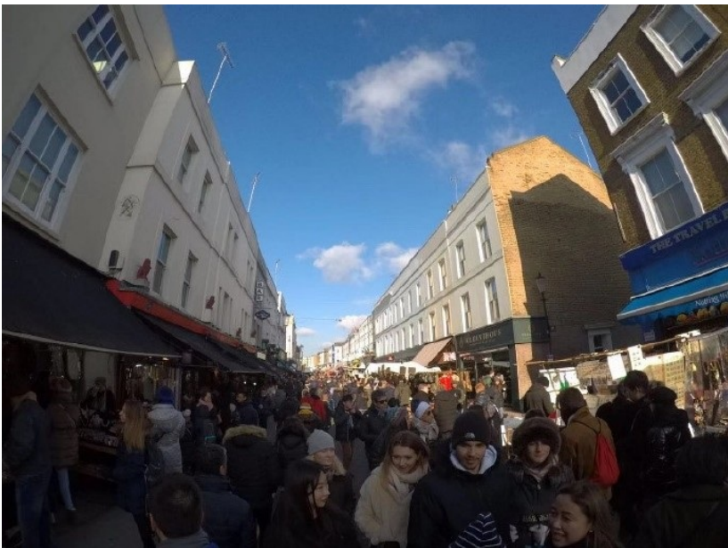
伦敦诺丁山这是一个有着各国情调的地方，在这里待上一整天，简直棒极了Portobello跳蚤市场、古董市集，异国风情。