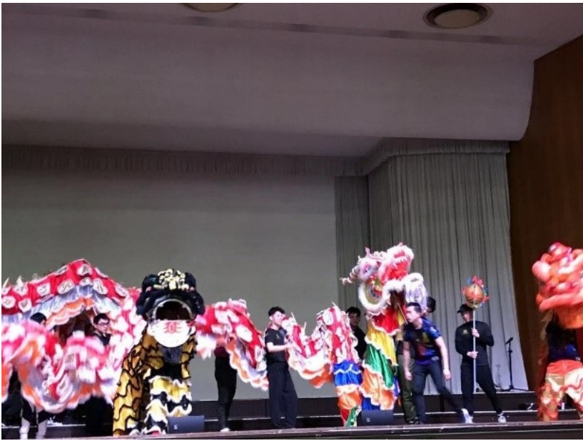
在埃克塞特大学感受中国的春节。