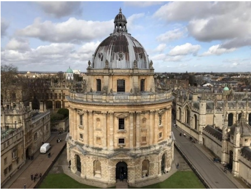
牛津大学，英语国家最古老的大学