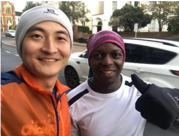
我的周末长跑训练的好搭档