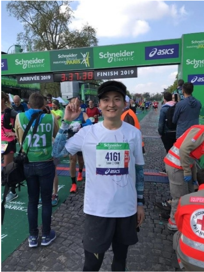
感受世界最浪漫马拉松，5万人的狂欢，2019巴黎马拉松