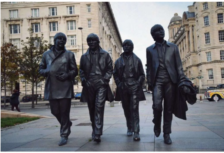
(利物浦披头士雕像)