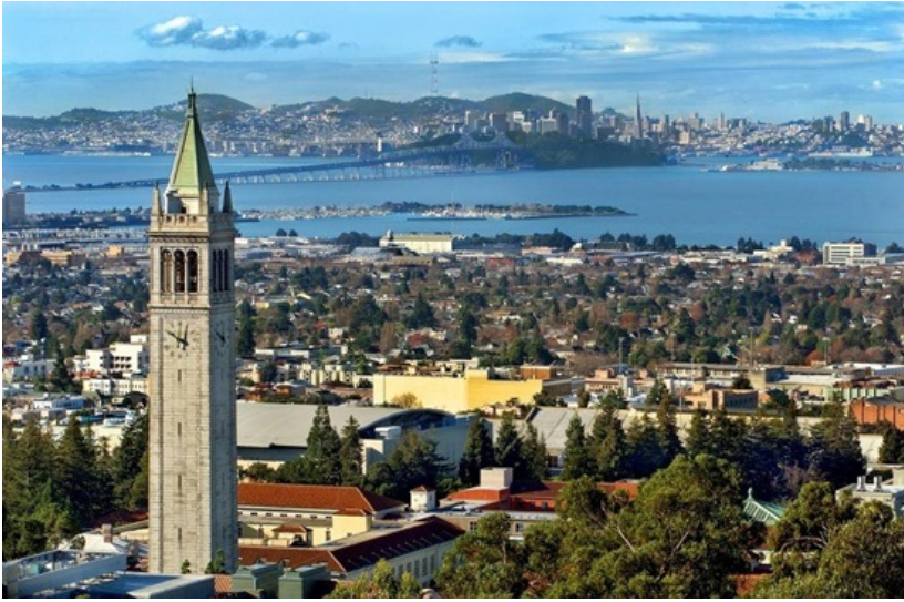
加州大学伯克利分校校园

在伯克利的最后几天，我常常忍不住打开相机拍下各种小细节：最常去的图书馆窗外的彩霞和落日，foothill餐厅的柠檬蛋糕配豆奶，每周一晚课结束后乘坐的校车，终日倚坐在大石墙下晒着太阳、专注地读着旧书的流浪汉……不是为了分享在社交平台上，而仅仅是想收集尽可能多的记忆碎片，让我对这片土地、这里的人们的记忆尽可能长久地鲜活着。每当这一刻我便真实地感受到我对这里的不舍。在伯克利求学的经历，给了我许多的冲击、挑战、惊喜以及满足感，无论是在学习还是生活方面，都让我有所收获、有所成长。 一、关于加州大学伯克利分校 伯克利是个小城，加州大学伯克利分校的校园就占据了城市的很大面积。刚到伯克利的时候，常听说街上游荡的流浪汉很多，抢劫、强奸多发，非常不安全，但其实这里的治安并不像宣传的那么令人担忧。学校警方UCPD提供夜晚护送服务，只要在手机上预定行程，就会有警察陪你从学校走回家，还有学校夜间班车可以乘坐，在有重大事件（比如游行示威，我还遇到过一次学校里检查出疑似炸弹的事件）发生时，学校会邮件、短信通知每一个学生，并且实时更新，所以并不需要对治安太担心。不过警惕一点还是有必要的。 学校很美，地形起伏起伏，外观独特的一栋栋建筑物散落在山丘和平地上。就像复旦有标志性的光华楼，伯克利也有一个地位类似的建筑——sather tower，登上塔还可以俯瞰整个小城、远眺对岸的旧金山。塔内有一架钢琴，每天的正午12点和晚上6点都会演奏不同的曲目，琴声非常梦幻动听。伯克利分校的图书馆极多，大约一共有十几个，我最喜欢的三个是Doe Library（主图书馆），East Asian Library（东亚图书馆）和Ethnic Studies Library。第一个的内部装修非常复古、气势恢宏，空间大而且通常人不多。第二个古色古香，颇有古典韵味，学习区的落地窗玻璃更是赏心悦目，但是人多，位子不太好找。第三个是一个小馆，人流量小，安静舒适。当然也不能漏下人气最高的moffit library，这是本科生专属的图书馆，大多数日子里通宵开放，所以需要刷夜的小伙伴们一般都聚集在那里。