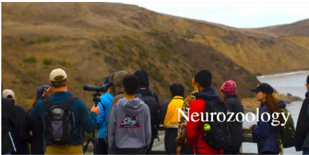
(▲伯克利Neurozoology Decal 小组在进行野外考察)