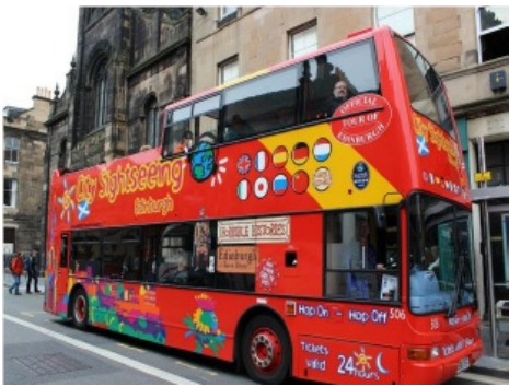
(爱丁堡的旅游观光车)

跟上海相比，爱丁堡这个城市并不大，我们日常生活主要在 old town，并且公交车略贵，1.7 磅一次，所以出行主要靠走路。爱丁堡的路崎岖不平，很多时候又需要上坡下坡，日常出行就可以保证有足够的运动量。这边的 bus 很多都是双层的，选一个阳光明媚的日子，找一辆可以到郊区的车，坐在二层靠窗的位置，晒着太阳欣赏沿途的风景，是一个享受爱丁堡慢节奏生活的好方式。