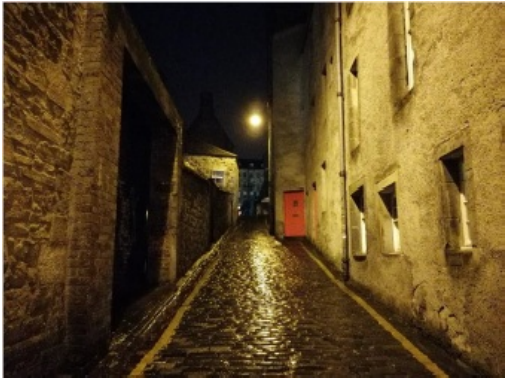
(我宿舍门前的路，这种看起来相当“原始”的路在爱丁堡很常见。)

我住在一个男女混宿的六人间的 flat，每人一个卧室，共用厨房和浴室（两个浴室，男女生各一个）。室友里有两个中国人、一个英国人、一个法国人和一个智利人。中国室友很nice，在我刚到对一切都不熟悉的时候给予了很多帮助。外国室友跟我的生活习惯差异比较大，比如晚上 11 点是我上床睡觉的时间，却是他们的晚饭时间，起初这些问题很是困扰睡眠质量不好的我。经验告诉我，外国室友不会主动做一些为别人考虑的事情，如果有什么要求及时沟通、提出要求，可以更好地解决问题。