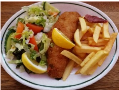
(在伦敦 Oxford Market 吃的炸鱼薯条)

爱丁堡大学没有学生食堂，学校里有咖啡馆和一些可爱的餐车可以买到食物。觉得英国菜能吃的可能只有炸鱼薯条和下午茶，食物有些单调。当然在这里也能吃到世界各地的美食，意大利菜、日料、韩国料理、印度菜、中餐...考虑到在外面吃一顿至少可能要花七八磅，我一般自己动手、丰衣足食，感谢英国单调食物和昂贵的物价让我的厨艺被迫有的有了很大的提高。