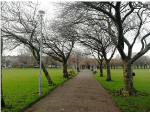
(冬天，图书馆后面的草坪)