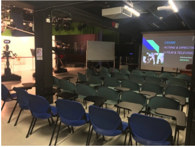
ACTING & DIRECTING FOR TV&FILMS的教室

-ACTING & DIRECTING FOR TV&FILMS 教这门课的老师是一个来自于澳大利亚的导演叫Ian，在来NTU之前在韩国的一所大学教导演和表演课程。这门课一周一次，一次3个小时，时间分配上就是一半理论教学一半实践教学。Ian是一个非常幽默有亲和力的教授，他上课的时候会照顾到每一个同学，经常随机选学生到前面去表演，通过不同的同学不同的表演方式来解释前面说过的理论性的知识。期末的总成绩是由两次小组作业和两次笔试成绩组成的。中期的时候，Ian会给大家不同的剧本，然后小组成员自行选择成为director、camera man、actor拍摄一组single camera的视频。期末的时候重新选择一个剧本，然后可以小组之间合作，拍摄一段multi-camera的视频。期末的闭卷考，Ian会给我们放2-3段不同的题材的电影片段，然后从导演和演员的角度去回答问题。作为一个门外汉学起来还是有点吃力，但是收获了很多，而且每节课都很欢乐~