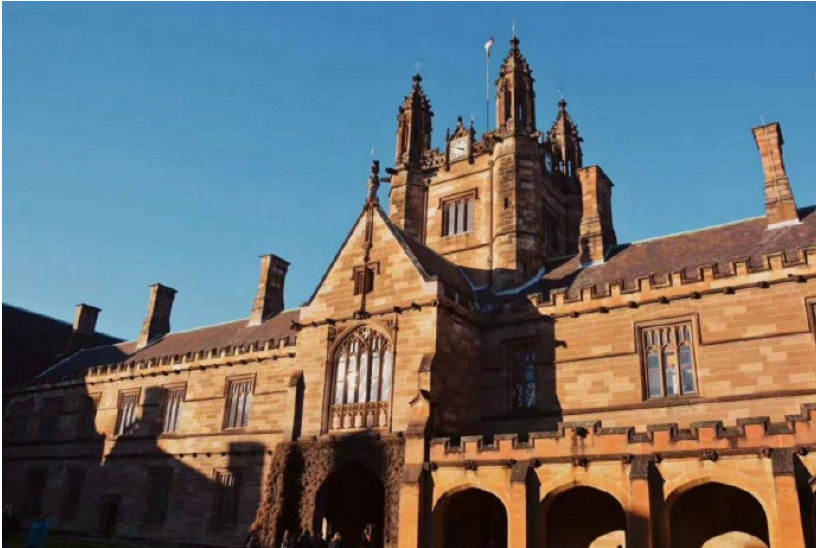
(悉大最有名的哈利波特楼剪影 实际名为四角楼(Quadrangle Building))

（据 local 说 honour 课程很受英美顶尖大学的认可，被视作最有力的证明本科生学术素养以及学习能力的条件之一。）