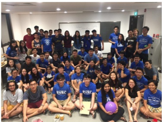
图5:与RVRC(ridge view residence college)的同学在一起 我深切体会到,寝室区已不仅仅是一个住宿的地方,更像一个小的紧密联系的社区,大家彼此熟悉,一同生活交流,团结友爱有着共同的信念与团队精神,在各类活动中不断深化情谊。这个学期,宿舍区的很多伙伴在生活各方面都给予我帮助和各类建议,我也十分感激能融入到这个温馨的大家庭。我参加了college举办的体育竞赛,dinner party,留下许多美好的回忆。

图4:交换时期所住单人寝室 新加坡国立大学的校内宿舍区分为三种模式,分为hall、college和residence. Hall与college注重宿舍区内学生的社交活动与寝室区文化,定期会举办各类活动,大家联系很紧密,有强制性的meal plan(寝室区自带的食堂区,每日为学生准备早、晚餐,有不同的种类,每日菜单也会更换),住hall的学生需不断参加集体活动争取积分在接下来的学期获得继续留宿的机会,住college的学生需修读college根据自己文化为学生准备的相应课程(强制修读且计入总学分)。而residence属于注重私人空间的独立居住区。我在新加坡的这一学期入住其中一个college:ridge view residence college.