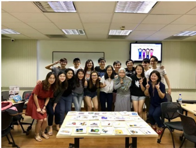
图2：小班教学的日语课堂 因为在新加坡是全英文授课，刚开学时会觉得语言方面有些障碍，可能上课有些专业词汇不是很能听懂，为赶上进度，每次上课前我都会提前打印好老师在网上传的课件，把不懂的词汇全部翻译熟记，并预习一遍下次课程的全部内容。这样又有利于课程学习，也使我的英语水平大大提高。 二、交流与活动 在国外交流，学习是很重要的一方面，同时与世界不同地区的学生一同生活、学习、交流文化也是十分重要的。在新加坡交流的这一学期，我结交了很多新朋友，有来自各国一同去交流的交换生，一起上课的课友，更是通过校内住宿系统这一途径认识了很多在国大就读的学生，有很早就到新加坡生活学习的中国人，也有很多新加坡当地人。通过参加不同的社交与社团活动，与他人不断沟通，我大大开阔眼界，了解到不同地区人们的文化与习俗，锻炼自己的社交沟通、为人处事的能力，在交流中不断成长，不断学习。刚开学，新国大学生会为帮助交换生更好熟悉校园环境，组织了一系列活动，我积极参与，很大程度帮助我更好的了解大学。

图1：自动控制原理课程的配套实验 我认为这种模式下，可能一学期学习的总量没有在复旦的多（本身国立大学一学期没有复旦长，且安排的 tutorial 较多）但是能使我们学得更扎实牢固，更能吃透所学知识，不易遗忘。值得一提的是，国大很多课程都有网络课程，即把本学期所有 lecture 录制后上传到网络，每周上完新课就会上传该节课的内容，我在课上没有弄懂的问题就可以通过这个平台再次回顾学习。老师上课会给参考教材和书目，但不是严格按照书上内容来上，也不会硬性规定一学期上完一本书内容，比较灵活，主要是以老师ppt与电子资料上内容为主，教材用处不大。值得一提的是，我在国立大学修读了日语课，课时很长，一周2小时 lecture+4小时tutorial ， tutorial 都是10人左右的小班，在课堂上不同国家的学生都得用日语进行最基础的对话交流，整个课程都在不断的说，不断的练习，非常有利于语言的学习，使我能在一种轻松愉快的氛围下学习日语，十分有趣。