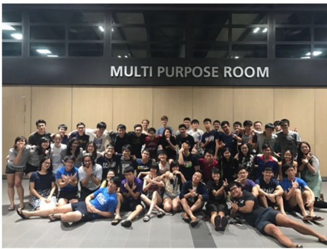
图6:RVRC的dinner party 三、个人成长 除了学习与交流，我自身也在一个学期的交流历练后有所成长。到达一个陌生的国家，一个陌生的环境，远离父母和家人，关系密切的朋友也不在身边，这时就需要我们独立思考，独自处理事情和应对各类紧急情况，迅速地适应新环境，融入其中，并结实新的朋友。从一开始的交流项目申请、出境准备，再到一段没有申请到寝室而忙于海外租房的日子（到去新加坡之前的一周才申请到校内住宿），到新加坡后的独立生活，选课，适应新加坡的英语环境，甚至在新加坡得了较严重的皮肤疾病在外自己到医院看病等等...整个交流过程我遇到了很多难题，但都通过自己努力很好解决，内心不断强大，处理事情的能力也不断增强。但一个人在国外还是有些感觉孤独无依的时候，在这个过程中我学习如何面对孤独，如何直面自己内心，与自己相处，同时通过自我学习，做一些自己感兴趣的事情来缓解孤独，让自己生活更加充实。 四、游历南洋 交流学习也给了我一个很好的了解新加坡的机会。我抓住这次机会，游历南洋，通过阅读相关书籍资料，参观新加坡国家博物馆了解新加坡历史；游览几大文化区域：唐人街——牛车水、小印度、阿拉伯街——甘榜格南；参观新加坡标志性建筑鱼尾狮、滨海湾等，从各个方面深入了解新加坡。