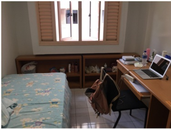
图4:交换时期所住单人寝室 新加坡国立大学的校内宿舍区分为三种模式,分为hall、college和residence. Hall与college注重宿舍区内学生的社交活动与寝室区文化,定期会举办各类活动,大家联系很紧密,有强制性的meal plan(寝室区自带的食堂区,每日为学生准备早、晚餐,有不同的种类,每日菜单也会更换),住hall的学生需不断参加集体活动争取积分在接下来的学期获得继续留宿的机会,住college的学生需修读college根据自己文化为学生准备的相应课程(强制修读且计入总学分)。而residence属于注重私人空间的独立居住区。我在新加坡的这一学期入住其中一个college:ridge view residence college.

图3:与各国交流生一同参加学生会活动 和当地学生沟通交流,能使我快速地了解新加坡这个国家,了解他们的习俗习惯和文化。当地人给我讲了很多关于他们日常生活,从小的学习过程,分享他们的爱好与经历,而我也向他们说起中国的文化,家乡的特色,和我们在国内的大学生活,他们也会问我们想了解中国的一些方面。我认为这种文化的交流与相互影响是本次新加坡之旅很重要的一个环节。新加坡的英语很特别,不同于我们平日经常听到的美英或英英,融合了东南亚的特点,与他们本地多元的文化密不可分,一开始到新加坡时我很不能适应,可通过日常不断的听,上课,与local不断地交流,并主动在YouTube上观看介绍当地的频道,已经能够听懂且熟练地交流。新加坡有四种官方语言:英语、华语、马来语和泰米尔语。我刚到对他们的语言体系不太了解,让我惊讶的是,新国大绝大部分local都会说流利的华语。和他们聊天后才知道,他们也是从小学开始就在学校系统学习华语(准确说是学习英语外要学习一门母语,若是马来族就学习马来语),考试也会涉及到华语的听说读写各项。我感觉他们说华语比我说英语要流利自然很多,应该是与他们国家多元的语言环境相关。华语渗透了他们生活的各个部分,有很多华裔祖辈,日常生活中随处可见华语的告示标语,地铁上也会有华语播报等等,这种从小到大的语言熏陶,使他们更好地掌握几种不同的语言。除了日常与他国学生交流沟通,新国大的校内住宿系统也令我印象深刻,通过住宿系统,我结交了许多朋友,大家住在同一区域,经常能见面,一同在dining hall进餐聊天,还有很多宿舍区组织的活动,使我们在课余时间缓解压力,增加彼此友谊。