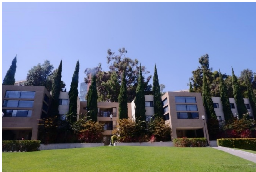
Figure.2 UCLA的宿舍 二、学期之中我的课余生活是怎样的？在学期开始之前，我参加了UCLA的Enormous Activities Fair。Enormous Activities Fair可以说是UCLA版的百团大战了，在UCLA最有名的Royce Hall前举行。我在那里遇到了我的室友，一个对于热心于慈善和中东难民问题的女生，于是我顺利成章的加入了他们的社团Generosity，负责产品的宣传摄影工作。比起社团，Generosity更像是一个初期的非营利性start-up。他们目前的业务是在线上线下卖一些手工艺品，成员们组织当地的贫穷的人们一起劳动，再将公司所得用于这些工人们的教育和技能提高方面——既授人以鱼，又授人以渔。一次偶然的机会我向他们展示了中国零售网站的买家与卖家即时沟通功能，他们惊讶于这种采买方式的便捷，我因为语言优势便承担了他们原材料采买的任务，我的室友也再次意识到了学好中文的好处，重新学起了她小学就放弃的语言，并且在暑假也参加了UCEAP项目来到中国专门学习中文。其他成员们对于Generosity付出了非常多的心血，为了拓大销量而经常自愿开车跨越洛杉矶送货，我也参与过几次。这种对于公益的热情让我感到震撼，我也感受到了美国大学生课余生活的精彩和对于社会的一份责任感。

Figure.1 著名的Santa Monica 海滩的日落 一、临行之前我做了那些准备？在出发之前，按照UCLA的邮件指示，可以进行选课、宿舍申请和online orientation视频的观看。Online orientation的视频是学校针对国际生精心制作的，里面向大家介绍了美国、洛杉矶以及UCLA的情况，内容包括文化、饮食、交通、住宿和学业的相关情况，对于新生快速适应UCLA生活、融入美国校园生活有很大的帮助。在选课时，交换生经常面临由于不满足prerequisite而无法选课的情况，可以与对方学校教务处老师、任课教授邮件或者当面沟通。UCLA的宿舍分为Classic Hall、Deluxe Hall、Plaza和Suite，除了Classic Hall有单人间之外，每个类型的宿舍都有两人间或者三人间，价格根据房间类型变化。六月初就可以知道被随机分配到的房型，每个学生还有一次提交重新审核申请的机会，申请一旦被通过，就不会有机会更改了。