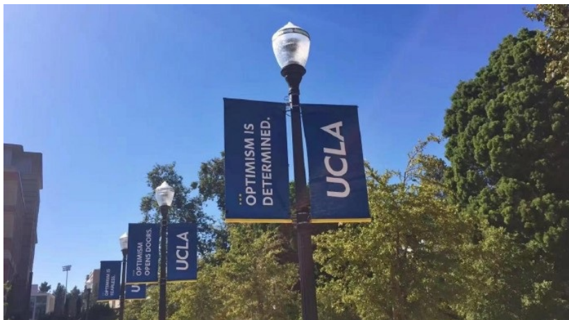
Figure.5 UCLA教会我的事情之一：乐观 我非常感激复旦能够给我提供这样一个交流的机会，我获得了语言的进步和许多学术只是，但又绝不仅仅如此。短短的四个月，我不仅来到了我梦想的城市，体验了美国大学生活，了解了美国文化，提高了自己独立生活的能力。也认识了很多与我思维方式不同的朋友，在新的环境中通过另一个视角认识不一样的自己，改变了许多思维定势，仿佛走进了一个更大、更广阔的世界。还从一个新的视角看到了我们祖国的崛起，让我对中国的传统文化有了新的认识，更为我是一名中国人而骄傲。

中国对于美国、对于世界的影响，从另一个角度更清晰的感受到了中国的崛起，这让我更加为我们的源远流长的文明、为我们日益强大的祖国而自豪。