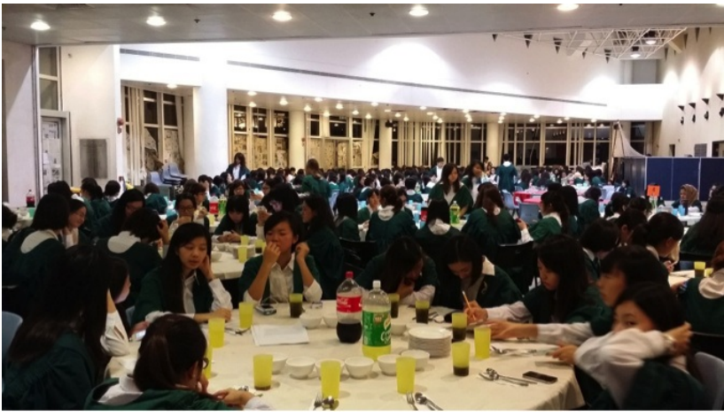
Lady Ho Tung Hall High Table Dinner