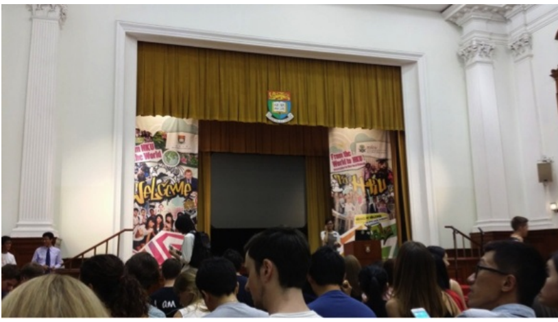
CEDARS为所有non-local students举行迎新会